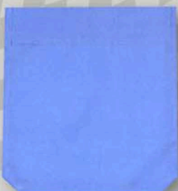
mit oder ohne Tasche