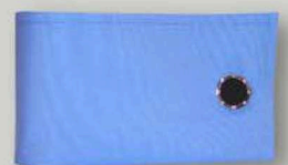
3 mit Umschlag